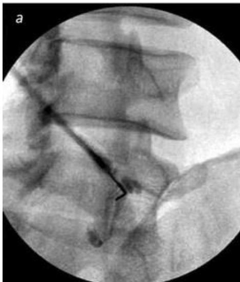
RX beeld van tijdens de behandeling